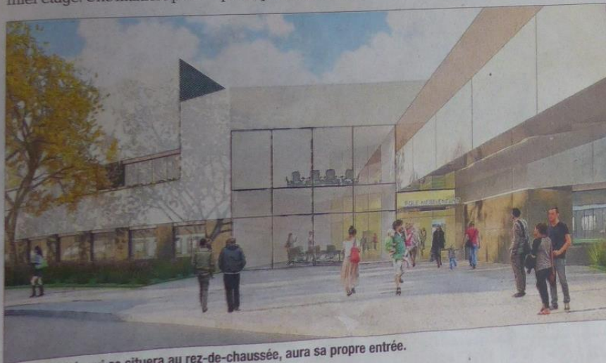
La maternité, qui se situera au rez-de-chaussée, aura sa propre entrée.