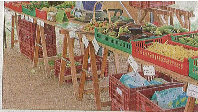
Les légumes sont bios, locaux et de saisons. En ce moment le panier comprend, notamment, courgettes, aubergines, concombres et tomates.

nant la mercredi edi ar Marques chèque vec un u lundi g-en- ns aux 3, place ctacle ndi s sur- et à Font mars au ns et ouverture des abonnements, le samedi 9 septembre, à partir de 9 h, à Billetterie Romans Scène, Les Cordeliers, place Jules-Nadi. → Forum des Associations Samedi 9 septembre, de 10 à 18 h, place Maurice-Faure et alentours. L'après-midi, animations et démonstrations. → ORPA Lundi 18 septembre : 14 h, jeux de société. Jeudi 21 septembre : 14 h, Acti'Mémoire. Mardi 26 septembre : marche, Marcollin. Départ 12 h 30, dépose-minute Marques Avenue. Inscriptions obligatoires aux permanences du club, rue Guillaume. Participation au forum des Associations, samedi 9 septembre. → Concessions au cimetière Un constat des concessions perpétuelles à l'état d'abandon sera dressé le jeudi 21 septembre, à 8 h 30, dans le vieux cimetière. Renseignements auprès du secrétariat du cimetière, tél. 04 75 02 08 61 ou à mairie +, tél. 04 75 05 51 51 ou mairieplus-contact@ville-romans26.fr